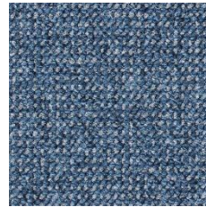
LIO-81 AZUL PIEDRA